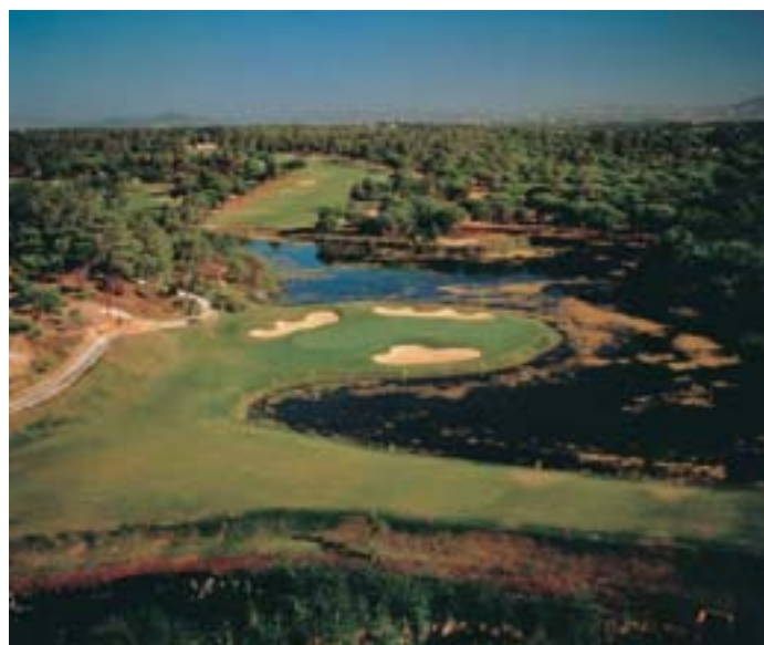
CAMPO DE GOLF SAN LORENZO