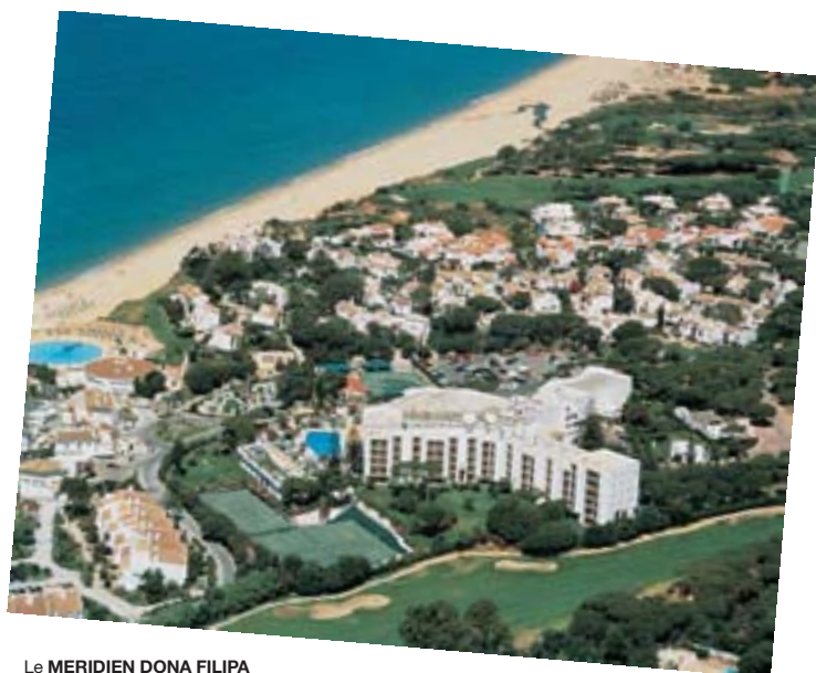
Le MERIDIEN DONA FILIPA & SAN LORENZO GOLF COURSE , situado en Vale do Lobo a orillas del atlántico y en el mismo campo de golf de San Lorenzo, considerado entre los cinco mejores campos de golf de Europa, el resort cuenta con diferentes pistas de golf, piscinas y todas las comodidades de un buen resort.