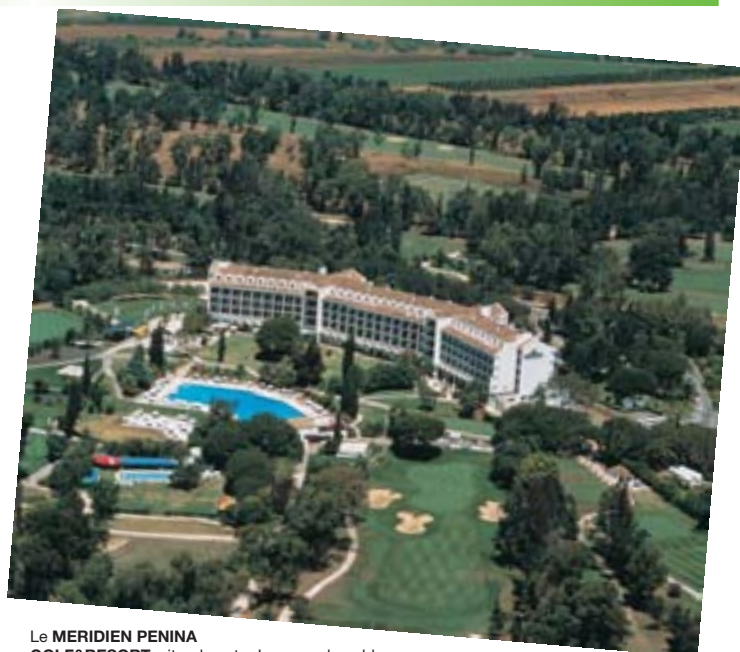
Le MERIDIEN PENINA GOLF&RESORT , situado entre Lagos y el pueblo pesquero de Potimao ofrece 3 campos de golf, con posibilidad de jugar en el renombrado Golf de San Lorenzo, a parte de las instalaciones del propio hotel como fitness, piscina, etc.